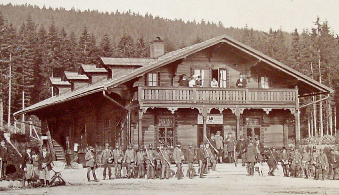
Restaurace „U Tetřeva“ v roce 1889 v původní podobě se schodištěm na levé straně.

nebylo provedeno a objekt zůstal v původní podobě s balkóny a verandou.