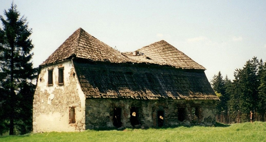
Stav Bílé hájenky v roce 2002, rok před demolicí.

Königem z Kynžvartu, který postavil nedaleké lázně v Pramenech. V dopise z března roku 1874 se píše: „V otázce stavby hájenky na Kladské jsem využil příležitosti a promluvil se stavitelem Königem z Kynžvartu, kterému byly zaslány příslušné plány a rozpočet k posouzení.“ V dalším dopisu ze srpna roku 1874 jsou zmiňovány i Königovy výkresy, které byly uloženy na správě. Je tedy možné, že autorem první hájenky na Králově kameni byl právě on. Stará hájenka stávala u cesty asi o 70 m dále od dnešní hájenky postavené až v roce 1913. Ve stejném roce se uvažovalo též o stavbě hájenky u Pramenů ve vzdálené části „Ziegenruh“, tedy v místech napravo od silnice z Pramenů do Čisté za mostem přes Dlouhou stoku. Tuto hájenku však nakonec nepostavili. K výstavbě hájenky se dochoval i návrh, který vyhotovil stavitel Roth z nedaleké Nové Vsi. Jednalo se o jednoduchou obdélníkovou stavbu podobnou hájence Rota, a je možné, že podobně vypadala i původní hájenka na Králově kameni.