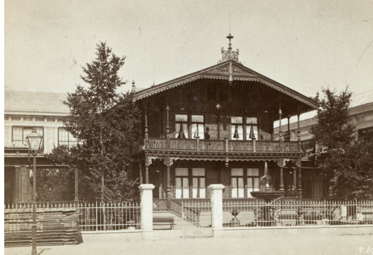
Švýcarský chalet od architekta P. Risolda na světové výstavě ve Vídni, 1873. Wien Museum, inv. 173701/128.

S ohledem na zvyšující se počet pracovníků a náročnost řízení panství rozšířeného o Krásnou Lípu a Žitnou se připravovala samostatná