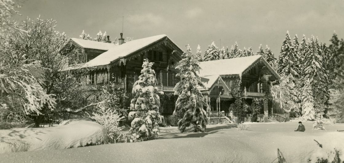
Zimní pohled na zámček Kladská z 20. let minulého století. Sběrka Městské muzeum Mariánské Lázně, inv. SP-3681.